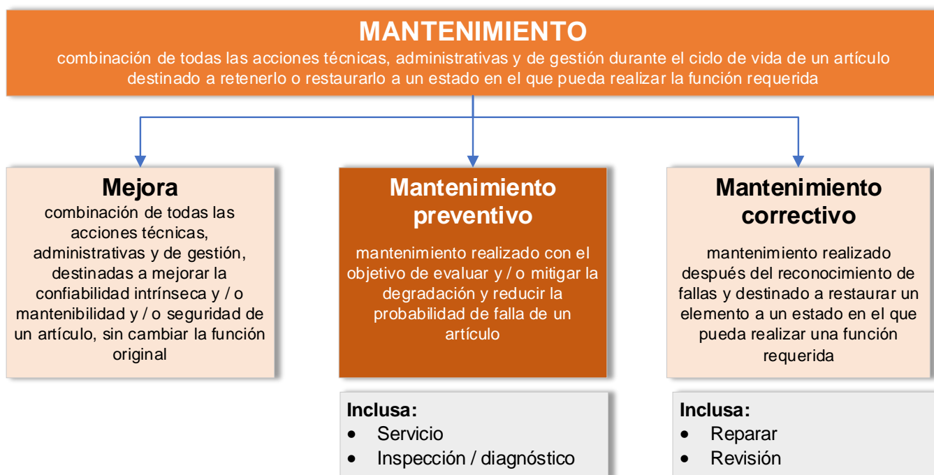
Figura 1: Terminología de mantenimiento según la norma EN 13306:2018

Según la única norma europea que describe la terminología del término mantenimiento (EN 13306:2018), el MANTENIMIENTO se define como sigue (figura 1):